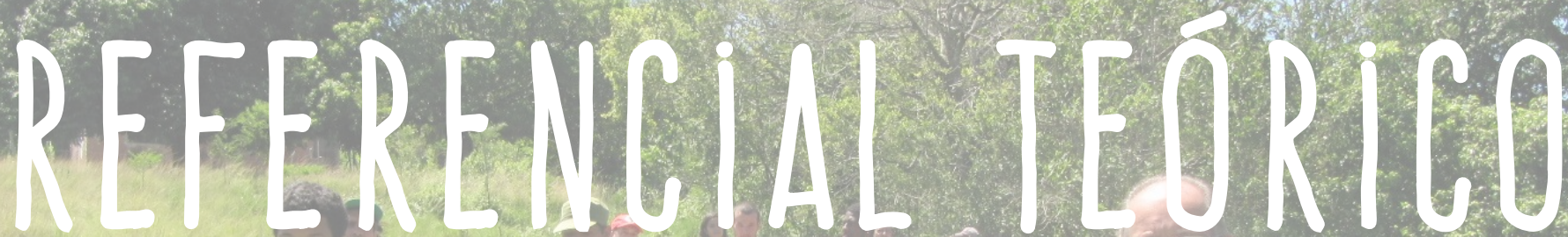
30 anos de Campo Alegre, Nova Iguaçu, 2014