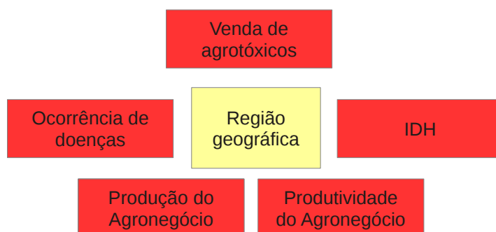
Figura 2: Relacionamento desejado entre uma região geográfica e suas mudanças estruturais no padrão de desenvolvimento e de doenças

Outro tipo de relacionamento citado durante as entrevistas é mostrado na Figura 2. Este relacionamento é feito do ponto de vista do território, e tem como objetivo sugerir alterações nos padrões de uma comunidades a partir de alterações no padrão de desenvolvimento do local. Existem diversos estudos que mostram este tipo de relacionamento, como os apresentados em [4], páginas 52 a 56.