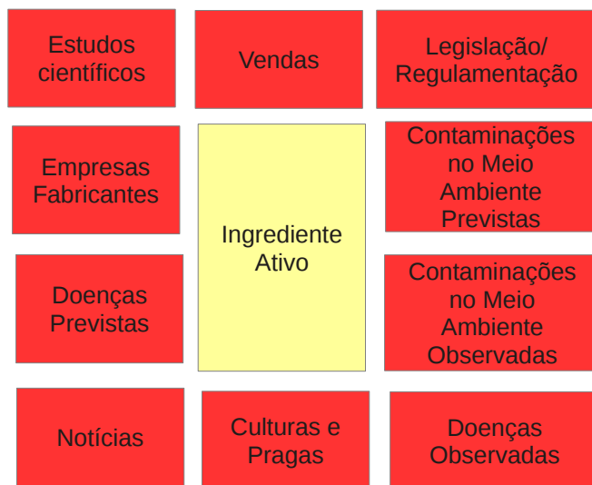
Figura 1: Relacionamentos desejado entre entidades, a partir do Ingrediente Ativo

O ingrediente ativo de um agrotóxico é a substância química sintética que é responsável pelo efeito do produto. Quando analisamos os efeitos dos agrotóxicos na saúde e meio-ambiente, faz mais sentido analisarmos a partir de cada ingrediente ativo, pois os efeitos são bastante distintos. Desta forma, chegamos ao primeiro modelo de relacionamento entre entidades, apresentado na Figura 1, a partir do ponto de vista do ingrediente ativo.