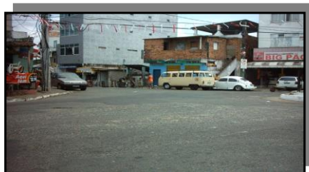
Figura 1 e 2 - Engenho Velho da Federação

Na formação inicial, a COOPAED contava com 05 membros, onde apenas dois membros possuíam uma vivência de trabalho coletivo, por já fazerem parte de outras associações de bairros ou por atuarem em trabalhos comunitários. Tais membros foram responsáveis pela formação política e produtiva inicial da pré-cooperativa, identificando outras pessoas com o perfil para o trabalho e transmitindo para os demais componentes suas experiências em trabalhos coletivos.