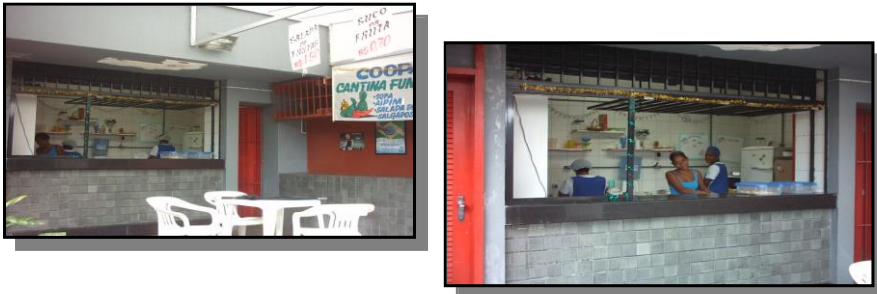
Figura 3 e 4 – Cantina do Campus da Federação (PA2)

Nos primeiros meses, percebeu-se que, mesmo enfrentando inúmeras dificuldades, dada a ausência de capital de giro, equipamentos e de capacitação técnica, o grupo era capaz de manter-se unido e confiante no seu propósito. Não existia preocupação com a “competitividade” e nem “concorrentes”, os jovens empreendedores, estimulados pela assessoria, pensavam apenas em agradar e conquistar sua clientela (estudantes, professores e funcionários da UNIFACS) objetivando garantir o pleno funcionamento da Cantina vista como uma oportunidade que não poderia ser desperdiçada. Como primeira ação organizativa, o grupo decidiu quais membros seriam responsáveis pela compra dos produtos, adotando como critério à experiência e o conhecimento dos pontos de venda dos insumos necessários (milho verde e frutas). Enquanto isso, os demais membros se ocuparam em buscar na comunidade doações que fossem úteis para a cantina, e empréstimo de panelas grandes com pessoas na comunidade que já trabalhavam com milho e pamonhas.