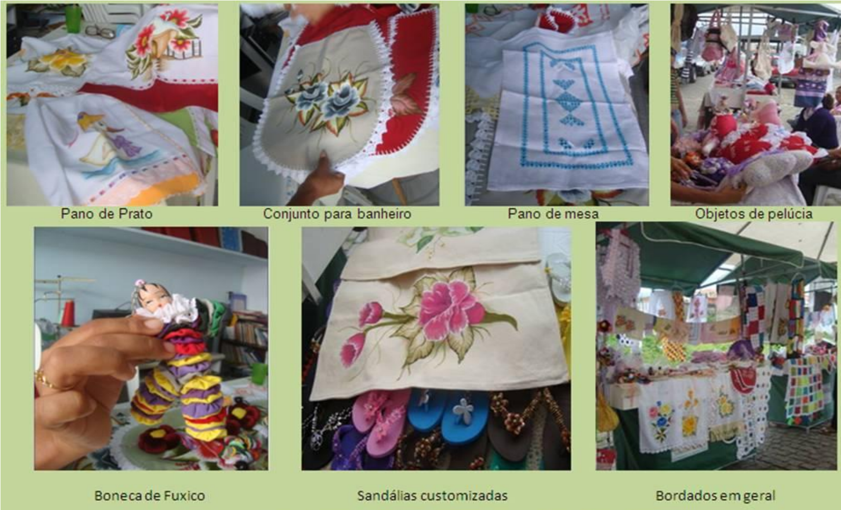
Figura 2. Artesanatos produzidos pelas mulheres da ACUP