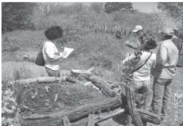
Oficina de Sistematização, Juazeiro-BA