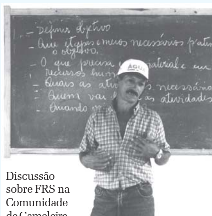
Discussão sobre FRS na Comunidade de Gameleira

Atualmente, a ASA-PB vem estimulando e mobilizando recursos públicos de programas governamentais para o fortalecimento das ações solidárias, a exemplo do Programa Cooperar e do Programa de Formação e Mobilização Social para Convivência com o Semi-árido (P1MC).