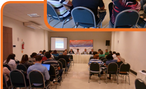
Oficina Regional do Sul – Itajaí/SC – 22 e 23/09/14

Secretaria Executiva: Av. Luís Viana Filho, 2ª Avenida, Plataforma III, nº200, CAB, Salvador - BA, CEP 41745-003 Tel.: (71) 3115-9945 Email: rede_gestores@yahoo.com.br