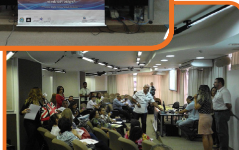
Oficina Regional do Nordeste – Salvador/BA - 18 e 19/09/14