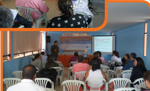
Oficina Regional do CO – Brasília/DF – 10 e 11/10/14