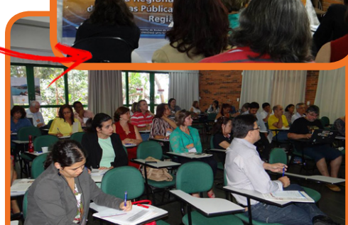
Oficina Regional SE – Vitória/ES – 25 e 26/09/14